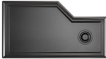
Fregadero Diade Gun Metal 3028 856